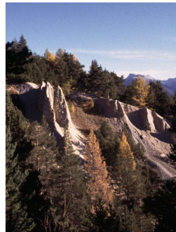
"à la découverte des laves torrentielles"

en partenariat avec : - la commune de St Chaffrey - l'association "le Naturoscope"